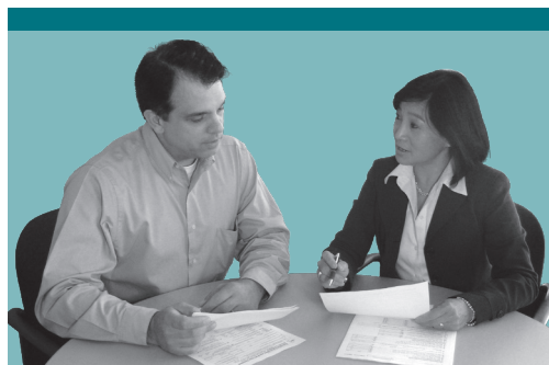
TR-24-HAI (8/15) (lèt bò a)

Itilize kont Sèvis sou Entènèt ou oswa rele nou nan nimewo (518) 457-5434 pou jwenn plis enfòmasyon.